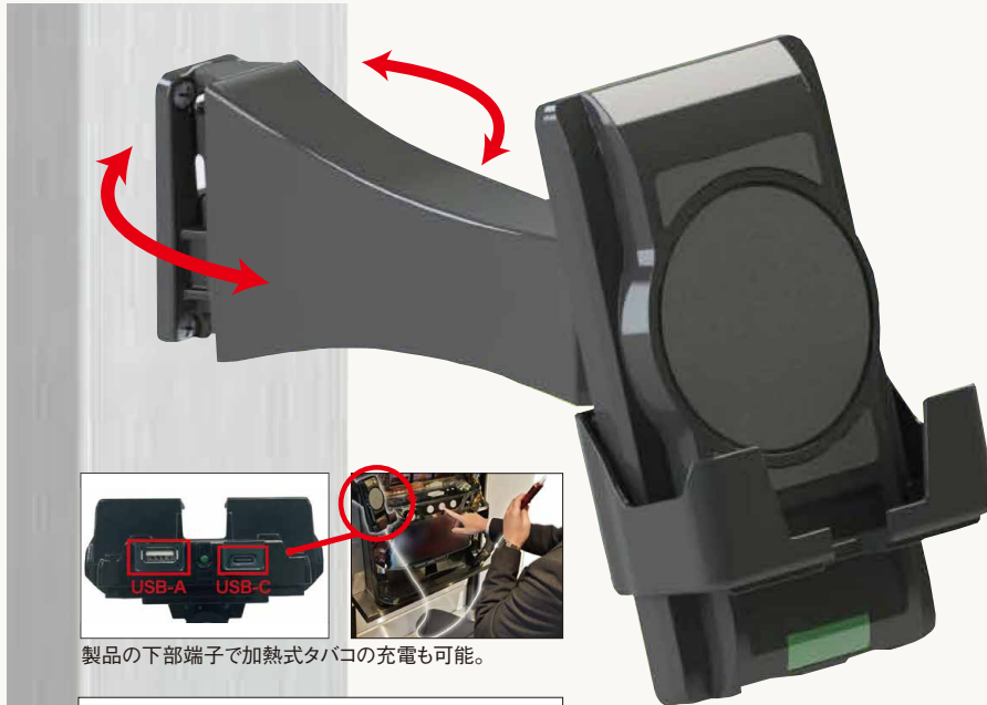
間柱を変えずに簡単設置。配線が見えない高クオリティ強化アームが特徴。

下部にUSB(Type-A、Type-C)端子を搭載し、加熱式タバコなどの充電にも対応。遊技台横に設置することで、動画の視聴や充電切れによる離席を抑え、稼働や客滞率の向上が期待できる。