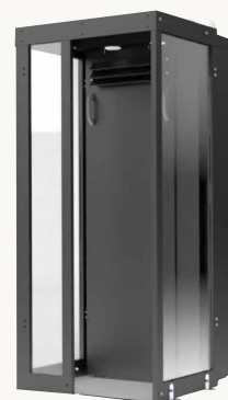
『どこでも喫煙ブース』

一方、1人用の『どこでも喫煙ブース』は設置場所を選ばず、喫煙者にとって最短・ノーストレスで喫煙できるため、遊技時間をアップさせる。ブースは扉のない構造で出入りもスムーズ。3層フィルターにより煙や臭いをしっかり除去する。 スマホと喫煙、双方の環境を整備することは、今後のホール運営における付加価値創出の一手となりそうだ。