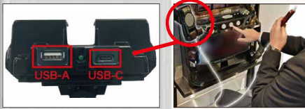
製品の下部端子で加熱式タバコの充電も可能。