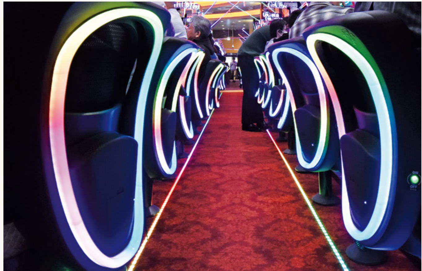
遊技イスの背面で多彩な光の演出を行う『スマイス』。大当たりやAT時等に光り、そして振動し、これまでにないエンタメ感を創出する。設置は既設のイス背面部にカバー式で取り付けるだけ。

ユーコー旗艦店、遊技客の要望受け増設を視野 ホールに新しいエンタメ感を創出する新明企画の『スマイス』&『スマラン』。《ユーコーラッキー37辻堂店》では増設を望むファンも。