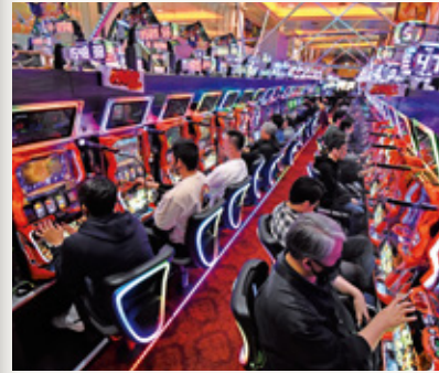
同店では島上や床にもLED装飾を施しており、『スマイス』『スマラン』の導入で更に賑わい感が増している。