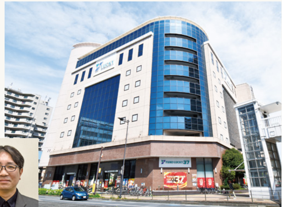
《ユーコーラッキー37辻堂店》(神奈川県藤沢市) JR辻堂駅前で営業する同店は、パチンコ450台、パチスロ383台の計833台を設置。19店舗を展開するユーコーラッキーグループの旗艦店の一つ。