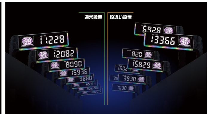
通常設置のほか、オプションのスタンドを組み合わせれば30cmの高上げが可能で、右のように段違い設置もできる。