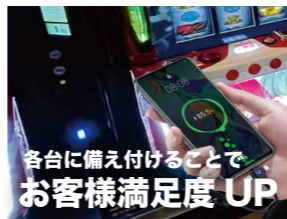
各台に備え付けることでお客様満足度UP