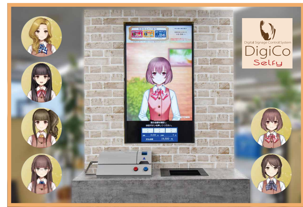
女性キャラクターが案内するデジタルサイネージ「DigiCo (デジコ)」と、計数ユニットが一体となったセルフ式景品交換システム「DigiCo Selfy」。年末に予定しているバージョンアップにより、客側と交換所側の使い勝手が更に向上する。

関東地区販売店：E・CRAFT 株式会社 電話：080-9586-7496 西日本総販売店：株式会社 東和販売 電話：086-238-3011 販売店募集中