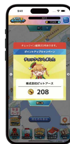
チェックインするとポイントを獲得。集めたポイントはレカガチャや、くじの購入に使用できる。