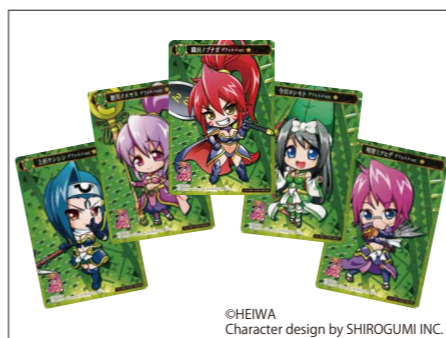
4月～6月にかけて展開中の「CR戦国乙女5～10th Anniversary～」の限定トレカ。その人気ぶりは凄まじい。