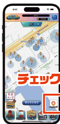
マイホを中心に設定された周辺スポットに訪れてチェックイン。