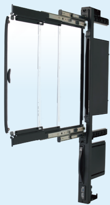
ハーフスタンダード(W50mm)