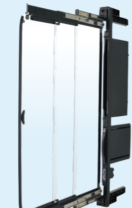
フルスタンダード(W50mm)