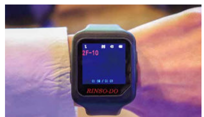
呼出は島単位で表示。表示部とベルト部は脱着式で衛生的。