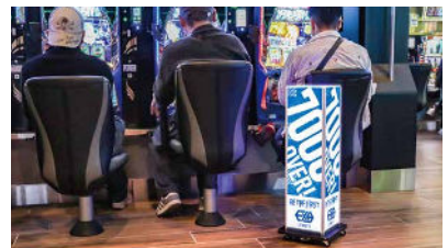
「LEDタワー」を使って獲得枚数をアピール。電源コードは不要で、キャスター付きのため移動も簡単。