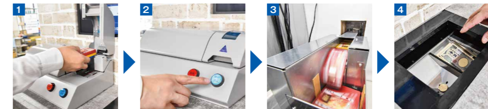
1 計数ユニットの蓋を開け、景品をセット。 2 開始決定ボタンを押下(蓋を閉じると自動計数する仕様もあり)。 3 搬送ユニットを通り、景品を自動識別。 4 サイネージに買取金額を表示し、現金が払い出される。

セルフ式景品交換システム「DigiCo Selfy」の導入が全国で増えている。理由は、景品交換所の人件費削減に大きな効果を発揮するからだ。