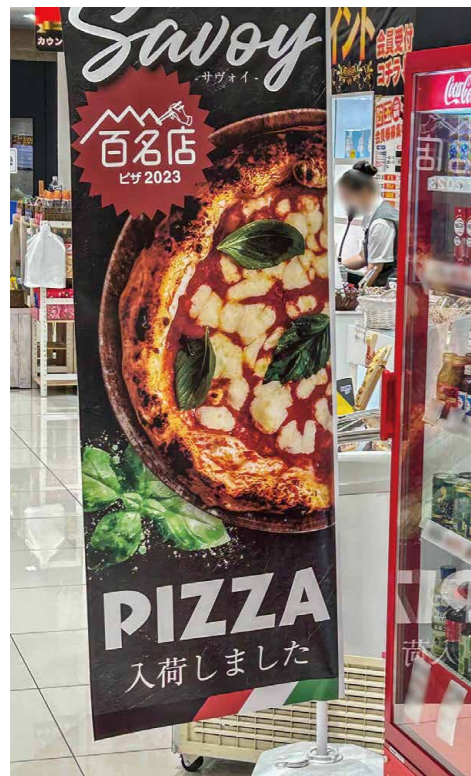
アイキャッチ抜群ののぼり旗など、販促用POP素材もITCが提供するため、すぐさま導入が可能だ。