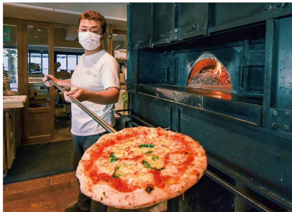
ピッツァの名店(SAVOY三宿通り店)の薪窯で実際に焼き上げられたピッツァをホール賞品として提供可能。

緻密なデータ戦略と業務効率化を実現する株式会社ITCのホール経営基幹システム「Compass(コンパス)」。その中でも特に利便性の高い賞品受発注機能が今回、全く新しい展開を見せている。詳細に迫る。