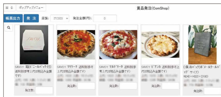
「ComShop」の賞品発注画面。「Compass」未導入のホールでも利用できる。

《モリナガ草牟田店》では、多くの客の目に留まるよう、賞品カウンター横に《SAVOY》のピッツァコーナーを展開した(左の写真参照)。合わせて、アイキャッチ抜群ののぼり旗や、販促用POPも活用してアピールすることで、多くの