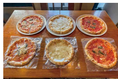
3種類のピッツァ(左からマルゲリータ、ピアンカ、マリナーラ)を取り扱っている。

ホール経営基幹システム「Compass」は、部署ごとに異なる様々なデータを三元化することで、システムコスト、デジタル分析コスト、作業コストをスリム化。加えて近年では、社内における業務の効率化・