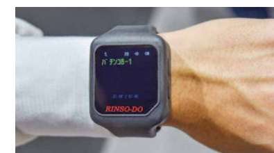
呼出は島単位で通知。履歴が残るため新人でも分かりやすく、素早い対応が可能になる。