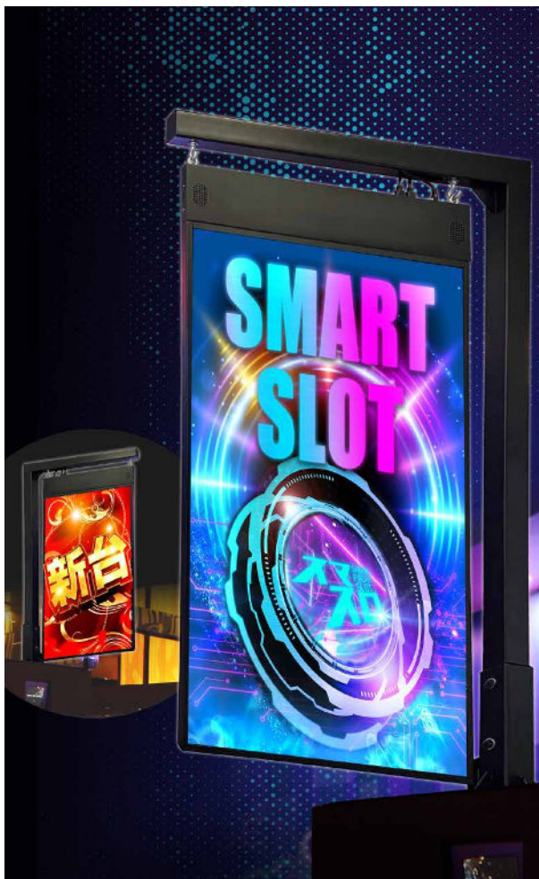
レインボーサイネージ『ダブルサイド』 表裏両面で異なる映像、テキストを表示することができる。スタイリッシュなデザインも相まって、島端や島上など様々な場所で活用できそうだ。(フレームはオプション)

表裏で全く別の映像表現が可能! 薄さは驚愕の25ミリを実現 このサイネージにはウラがある!