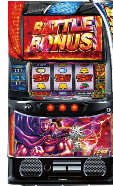
『スマスロ北斗の拳』