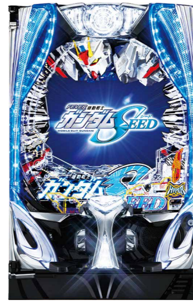
『Pフィーバー機動戦士ガンダムSEED』