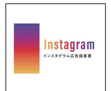
インスタ広告でホールの集客をサポート。

新型コロナウイルス移行後初 なる大型商戦期を迎え、『ピー クリック』と『インスタ広告』 の合わせ技で、業績アップを 狙っていきたくところだ。