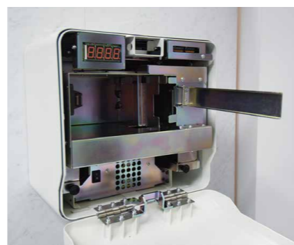
従来比で約40%の小型化を実現した金庫部分。 紙幣の収納枚数は約800枚。視覚的にも目立たず、島端スペースを有効に活用できる。