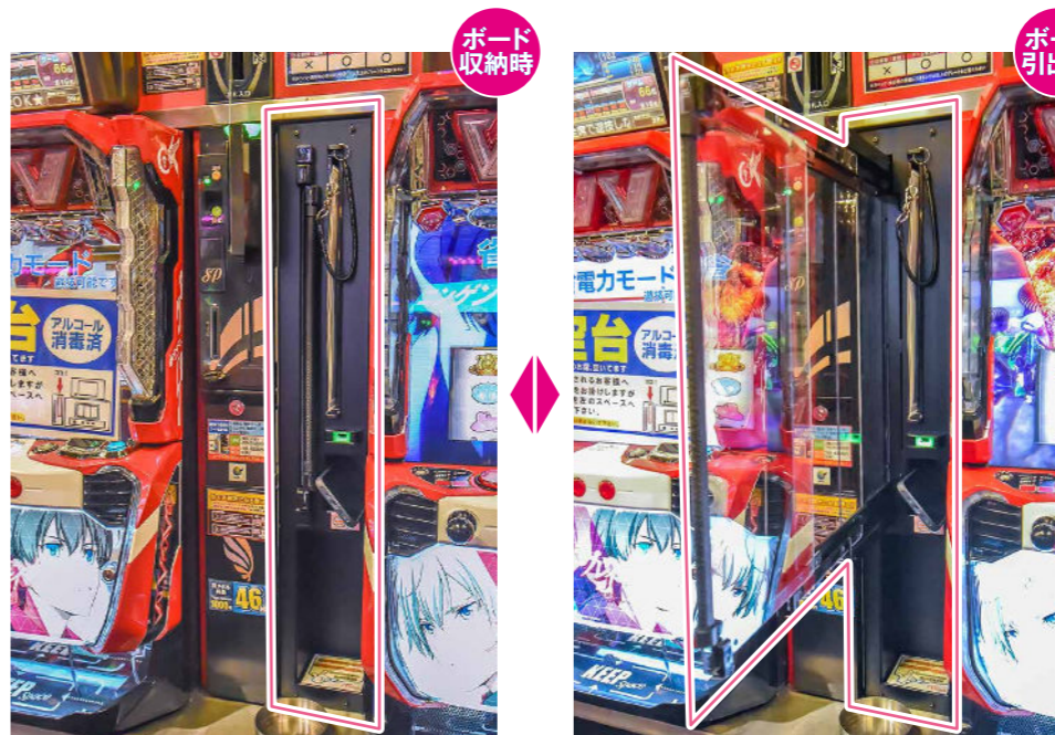
ゼウスの「オーダーメイド式多機能間柱&台間ボード」なら、台間幅の広狭に関わらず遊技時の快適性を大きく向上できる。