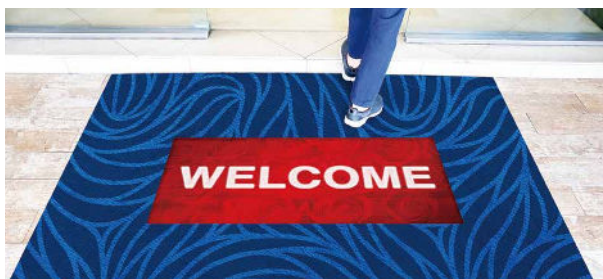
玄関マットと組み合わせて使用できる。高い強度を誇るため、LEDマットビジョンの上を歩いても問題はない。