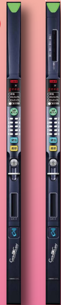
MX-140K1-93 紙幣搬送接続仕様 MX-140K1-94 紙幣ストック仕様