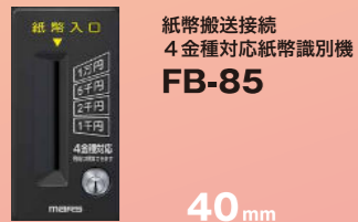
紙幣搬送接続 4金種対応紙幣識別機 FB-85