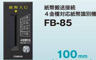
紙幣搬送接続 4金種対応紙幣識別機 FB-85