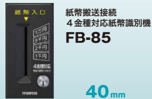
紙幣搬送接続 4金種対応紙幣識別機 FB-85