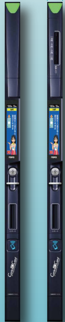
MX-140K1-84 紙幣搬送接続仕様 MX-140K1-85 紙幣ストック仕様