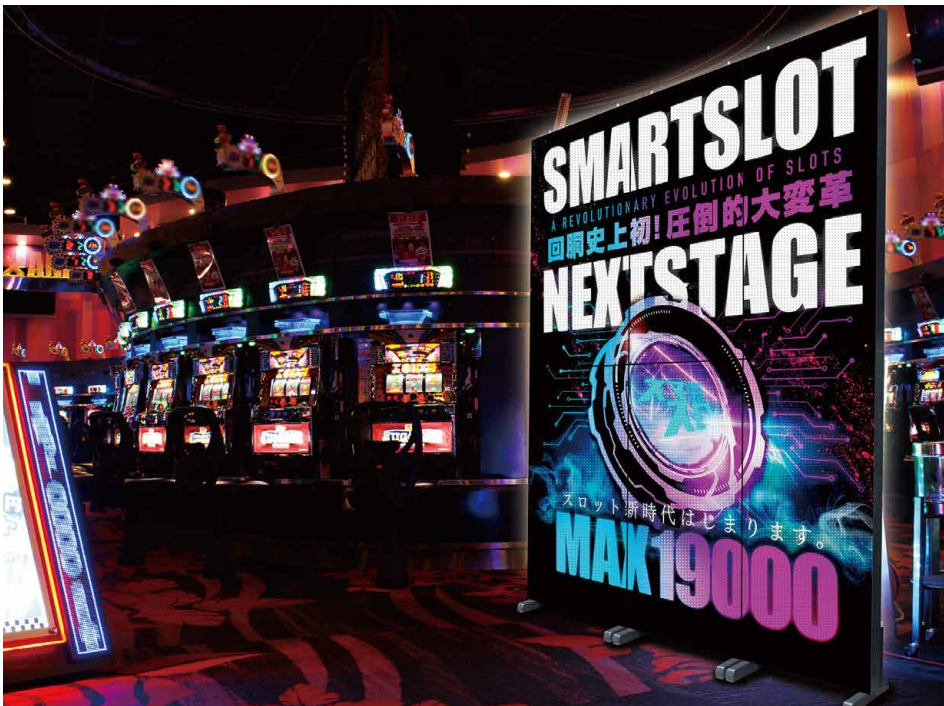
壁掛け&連結スタイルに加え、スタンド式を組み合わせることで、より高いアイキャッチ効果が実現されている。