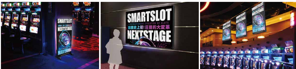
左から、スタンド式、壁掛け式(3連結イメージ)、天吊り式の設置例。店舗状況に応じて、様々な設置対応が可能となっている。