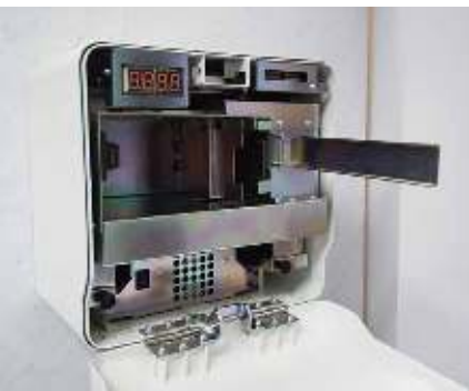
従来比で約40%の小型化を実現した金庫部分。紙幣の収納枚数は約800枚。視覚的にも目立たず、島端スペースを有効に活用できる。