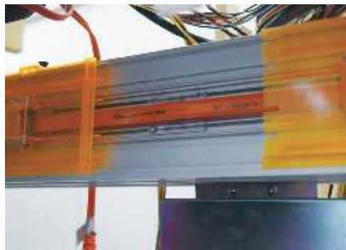
紙幣搬送のレール部分もシンプル構造。仮に紙幣が詰まった場合、不慣れなスタッフでも簡単に扱えるのが強み。ベルトの耐久性も向上している。