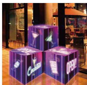
キューブ型LEDビジョン