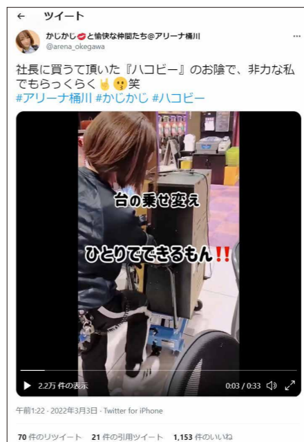
「ハコビー」は意外なところでも反響を呼んだ。入替機様の動画がツイッターでバズり、再生回数2万回以上を記録。ファンのみならず、同業者からも多くコメントが寄せられた。

実は梶さん、女性スタッフでは数少ない入替作業に従事するメンバーの1人。「入替に限らず、とにかく仕事の幅を広げ