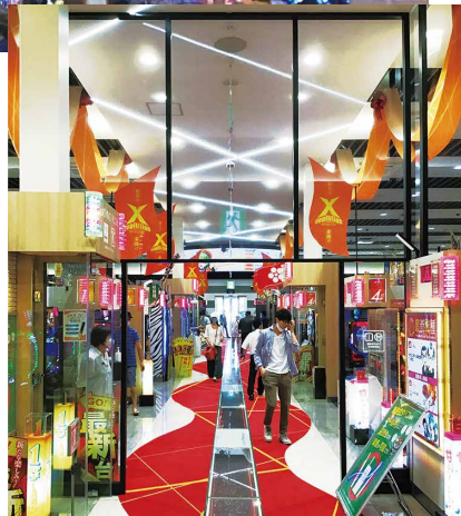
中央通路区画の施工事例。