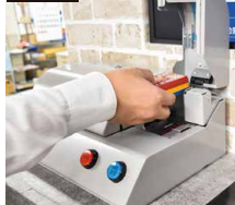
計数ユニットの蓋を開け、景品をセット。