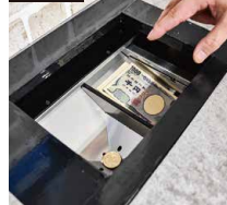
表示金額を確認し、ボタン押下で現金払出。

東和商事のセルフ式景品交換システム『DigiCo Selfy』は人を介さない景品交換を可能とする。交換の際に踏む手順は大きく4ステップのみと、非常にシンプルでわかりやすい。まず、「計数ユニットの蓋を開けて景品をセット」する。そのあと「開始決定ボタンを押す」と、「計数ユニットが景品を自動識別」、サインージに合計金額が表示される。その金額を確認した上で再度ボタンを押し、「払出ユニットから払い出される現金を受け取る」ことで交換終了となる。