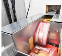
搬送ユニットを通り、景品を自動識別。