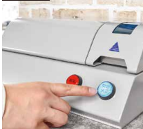
開始決定ボタンを押下(任意設定可能)。