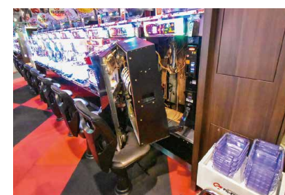
旧来の入替作業では遊技台をイスに置かなければならず、傷つける心配もあった…。

遊技機の積み下ろしから運搬、設置まで、一連の入替作業を強力にサポートする「ハコビー」はブルー、レッド(特許出願中)、ブラックの3タイプをラインナップ(特長は画像参照)。何れもスタッフの体に負担の無い入替作業を実現する全く新しいアイテムだ。