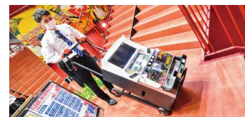
平面は2輪車の要領で移動。