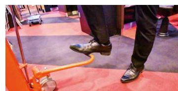
ブルー同様、油圧式で力は一切不要。