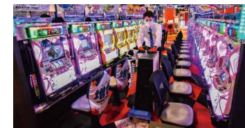
スリム形状で狭い島間もスムーズに移動。