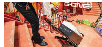
階段の角度に合わせて。イスの真後ろからそのまま設置できる。