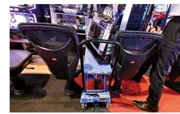
イスの間に入れて高さを合わせるだけ。