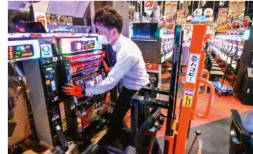
配線後、正面から設置するだけ。