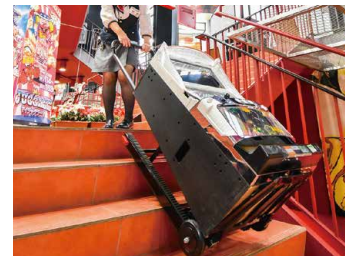
女性スタッフでも力不要で上げ下ろし。