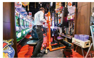
イスの真後ろからそのまま設置できる。