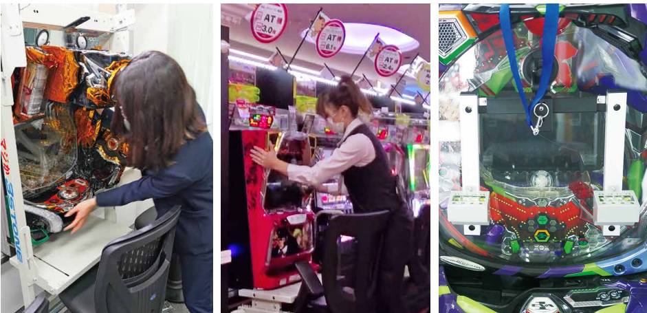
入替専用台車と取付機等を用いた設置作業。写真左がパチンコ機、同中がパチスロ機取り付けの様子。ES向上の入替環境を実現、女性でも簡単に作業が可能となっている。また、右の写真は、台を開放せず、左右の気泡管で傾斜を測定できる『傾ショック』。

外注費のコスト削減で集客施策を積極展開 効率化した入替業務で内製化を推進 多くのホール関係者が積極的な集客施策を展開しようと考えを巡らせている今、必要となる予算の捻出手法として関心が寄せられているのが、入替業務の内製化による外注コストの削減だ。