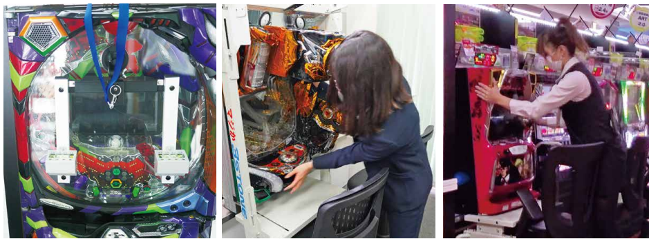
(左)パチンコ台を開放せず左右ダブル気泡管で測定可能なガラス面傾斜測定器『傾ショック』。最近の装飾物のある出っ張り台枠にも影響されないため、入替現場では大絶賛。釘に触れないため釘曲げ防止にも。(中)がパチンコ機用台車の『マジカ』、(右)がパチスロ機用台車の『マジカスロット』を使った設置作業の様子。スライドさせるだけで設置できるため、女性スタッフでも容易に作業が可能だ。 ※動画は上記QRコードで要確認。