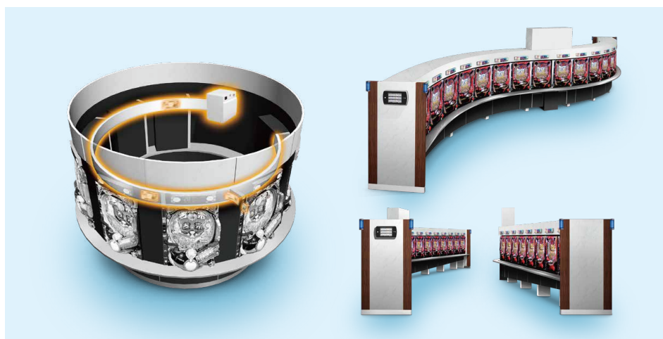
「SIMPLE LINE (シンプルライン)」は、最小R島対応で自由な台割付、レイアウトが可能。