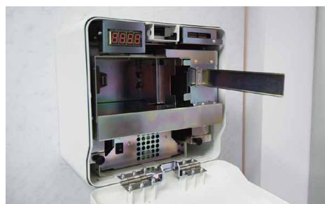
従来比で約40%の小型化を実現した金庫部分。紙幣は約800枚を収納できる。目立たず、島端スペースの活用にも最適だ。