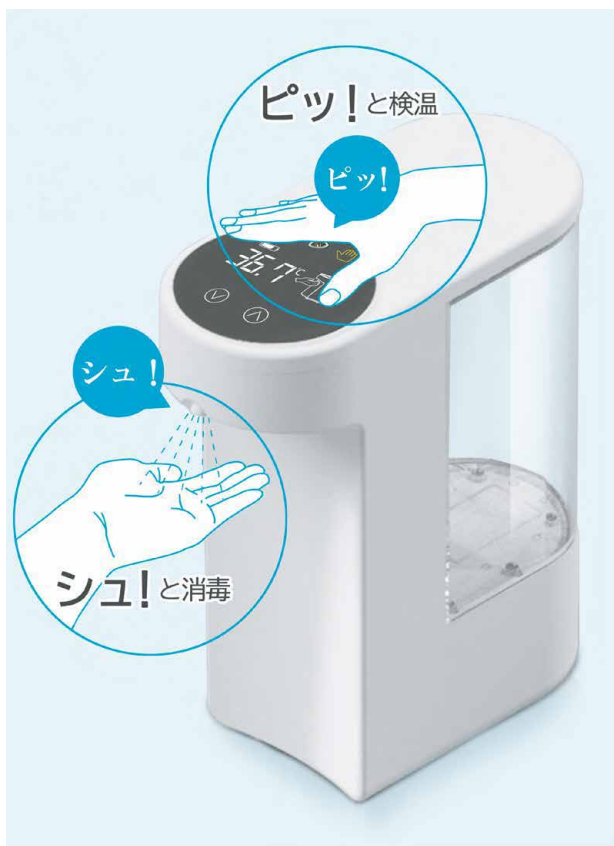
コンパクトなサイズながら、検温と消毒を1台で行うことができ、さらに操作性も直感的で分かりやすい。また、非接触タイプのため安心して使用できる。

の高さ、使いやすさが特長となる。使用方法は、製品名の通り直感的で分かりやすい。製品の上部にピッと手をかざせば検温、吹き出し口の下にシュッと手をかざすことで手指消毒が行える。