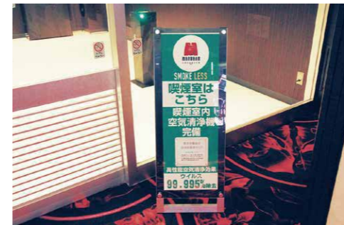
喫煙室入り口付近に置かれたイーゼルで、遊技客に「空気清浄機」の設置をアピールしている。

「スモーククリア エアクリンW」によって喫煙室内の空気環境を大幅に改善。快適な喫煙環境を創出する。また、100V電源があれば簡単に設置できる点も特徴だ。